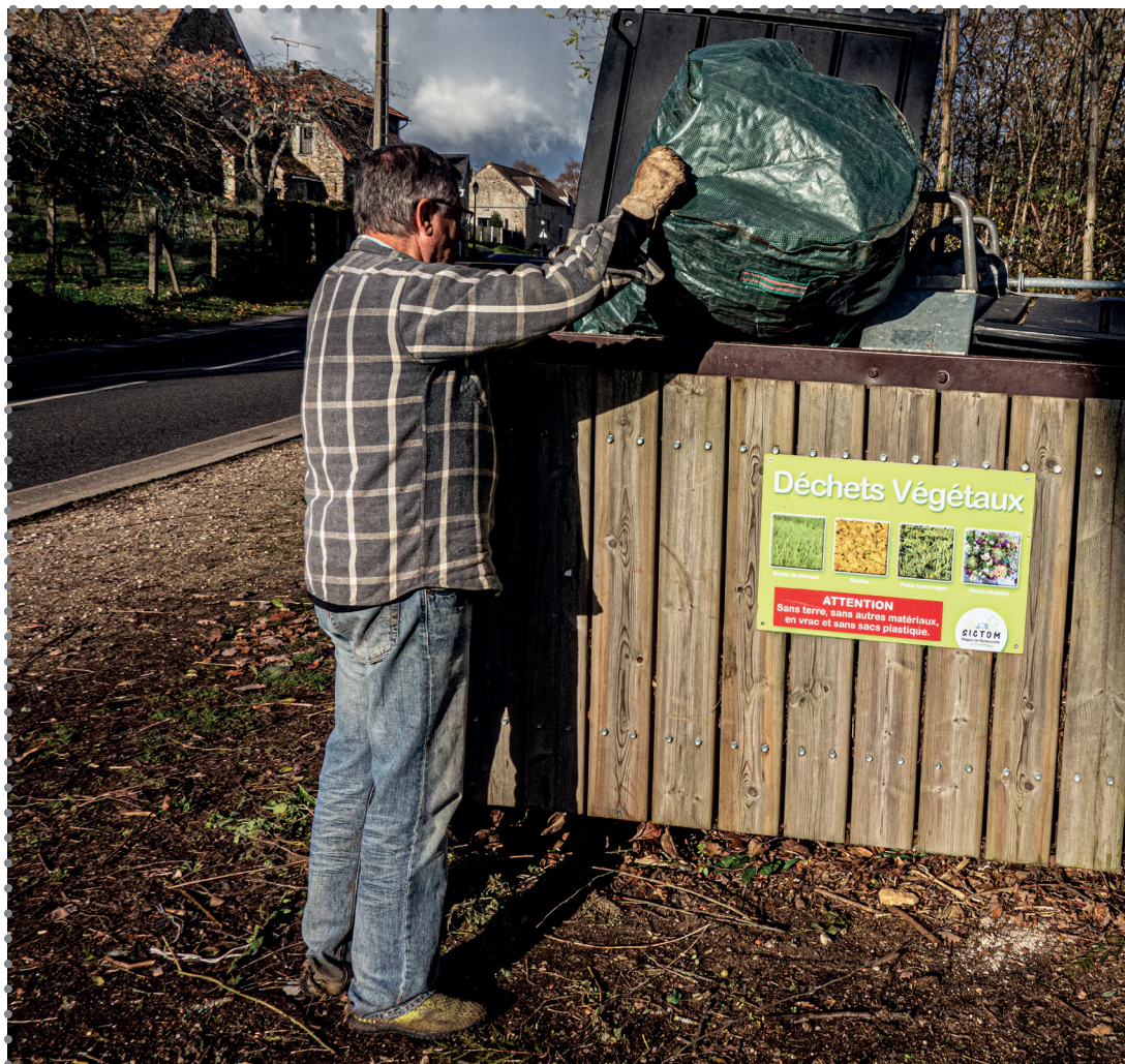
DES DÉCHETS ET DES HOMMES