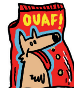
6 Sac de croquettes OUI / NON

Réponses : 1. OUI si la boîte n'est pas déformante d'huile et de sauce tomate ; 2. OUI, désormais les bouteilles d'huile se recyclent : celles en plastique dans le bac bleu/jaune, celles en verre dans le bac à verre ; 3. NON. Par contre des bacs de dépôt de capsules aluminium sont à disposition en déchèterie pour leur recyclage ; 4. NON. Même si l'aluminium se recycle sans fin, les petits volumes tels que les feuilles, celles par exemple qui protègent le chocolat, sont trop petits pour être gérés dans une unité de tri ; 5. NON car trop petit, mais le carton est le bienvenu dans votre bac à compost ; 6. NON. Ces emballages souples, comme les films plastiques, sont en PEBD (polyéthylène basse densité), un matériau dont les filières de recyclages sont rares en dehors de l'industrie mais qui devraient se développer dans les prochaines années.