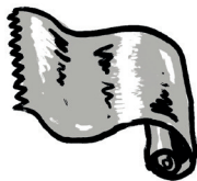
4 Papier aluminium OUI / NON